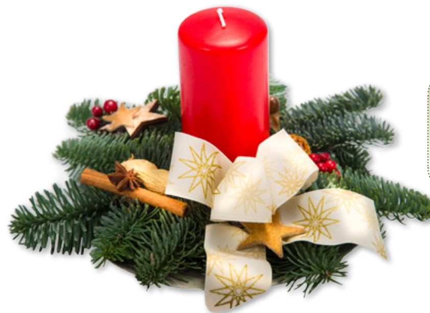
Gesteck, Nr. 1 1 Stumpenkerze 6 x 12 cm