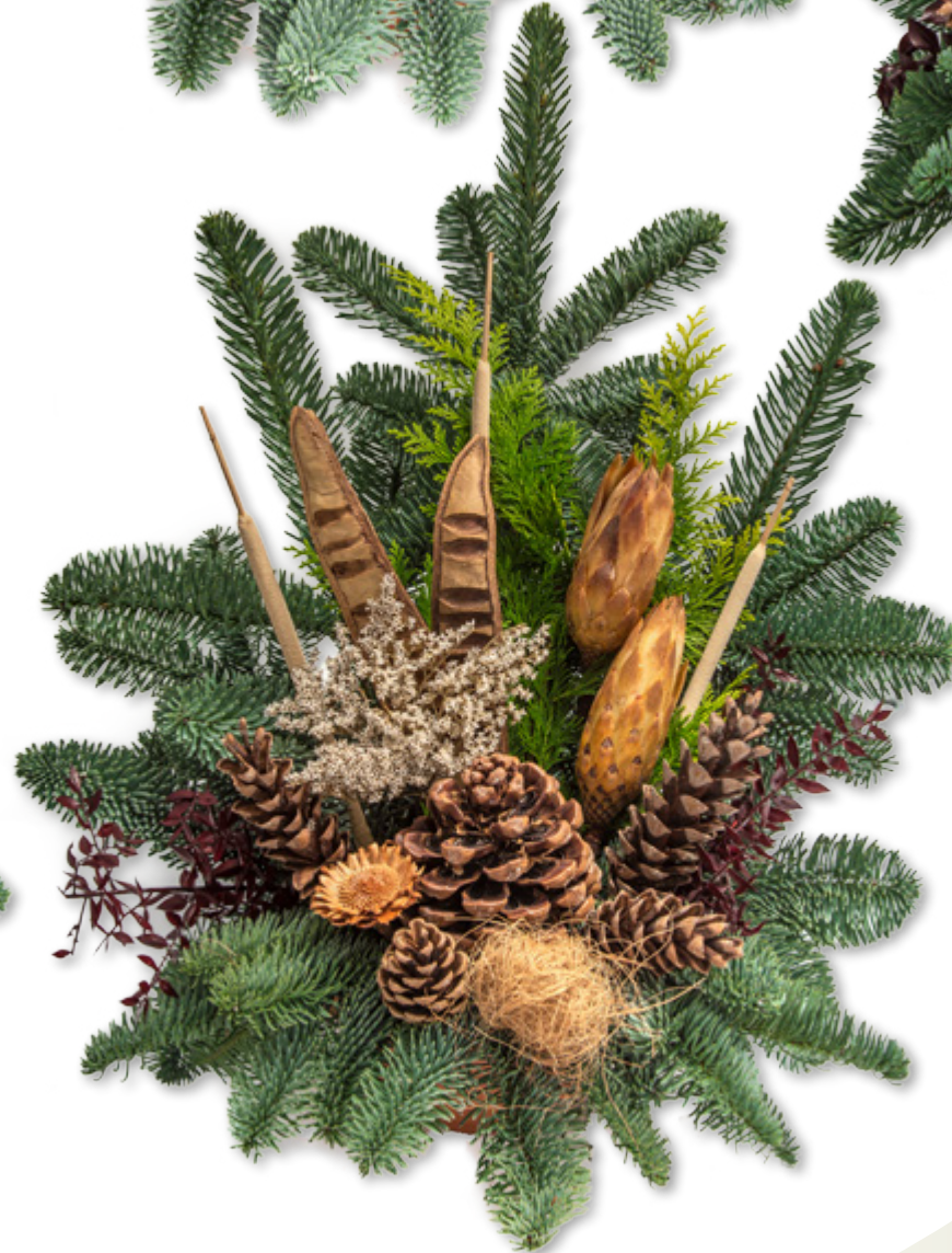
Tonschale, klein Ø 16 cm