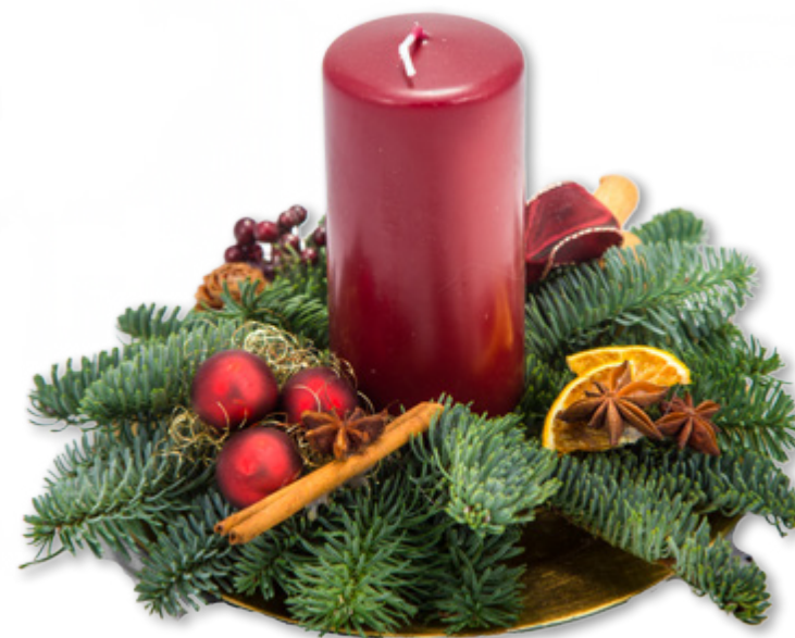
Gesteck, Nr. 1R Ovale Schale 1 Kerze Rustic 6 x 11 cm