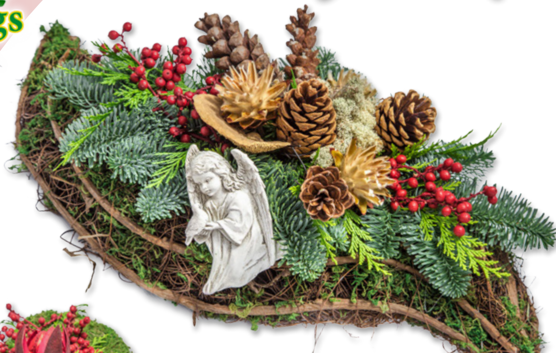
Gesteck, Elipse Moos, Rattan, Salim 40 - 50 cm lang