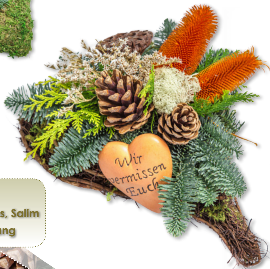
Herz Rattan, Moos, Salim ca. 30 cm lang