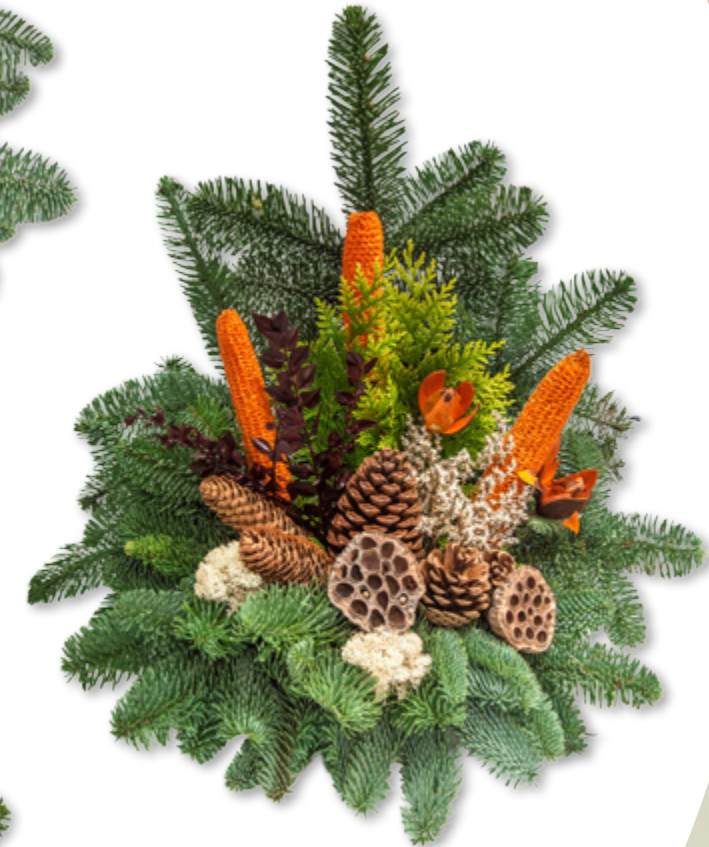
Dieses Gesteck wird auf Moosy in einem Drahtkorb gesteckt.