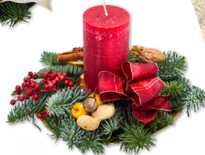
Gesteck, Nr. 1 1 Stumpenkerze 6 x 12 cm