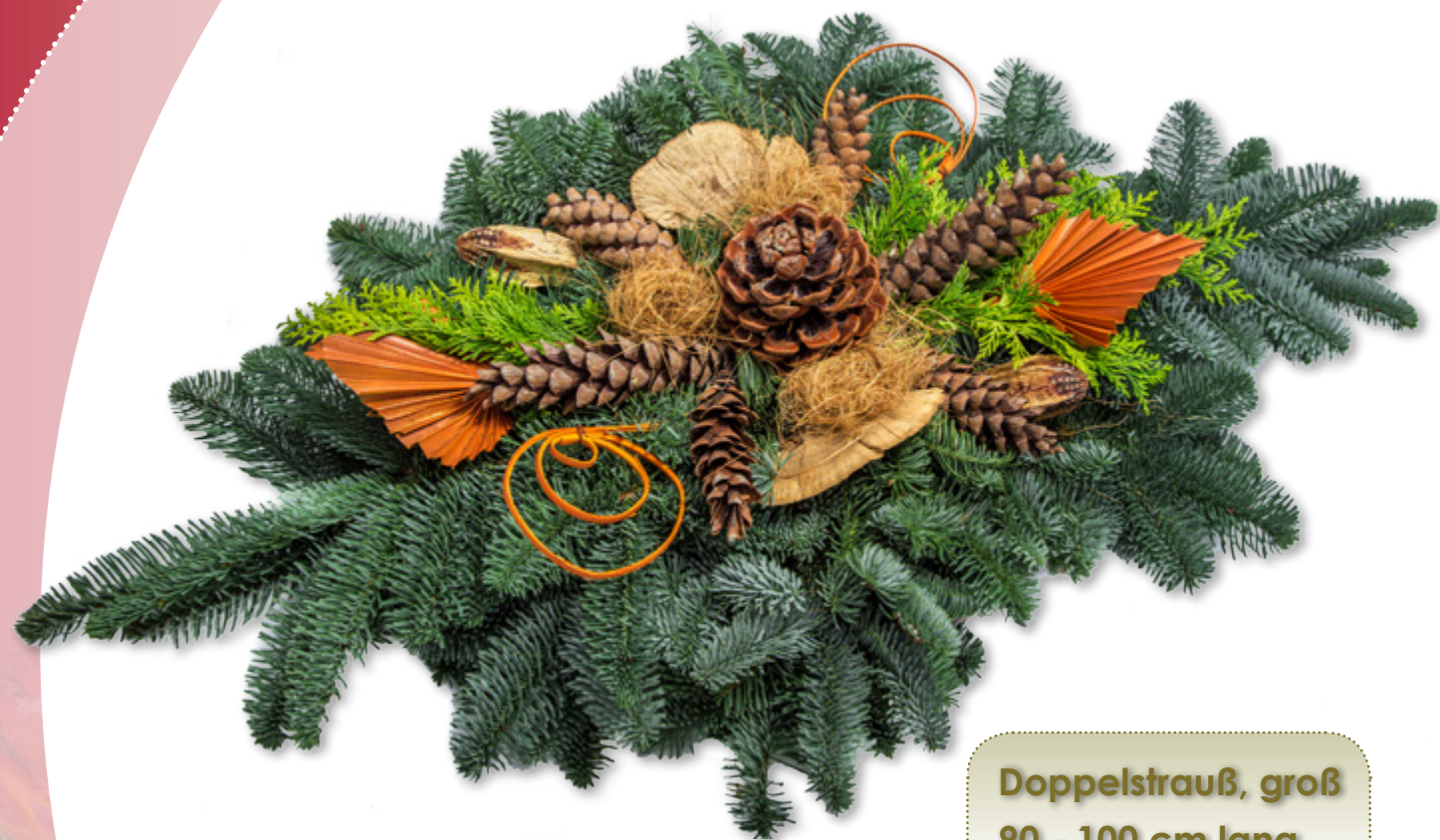
Doppelstrauß, groß 90 - 100 cm lang

Unsere Doppelsträuße werden auf balliertem, erdfeuchten Torf gesteckt.