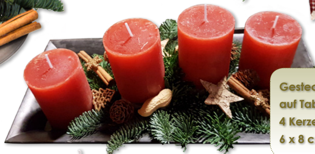
Gesteck, Nr. 4S auf Tablett 4 Kerzen Rustic 6 x 8 cm