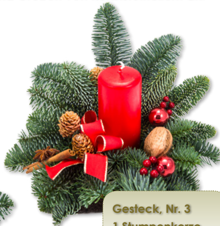
Gesteck, Nr. 3 1 Stumpenkerze 5 x 10 cm