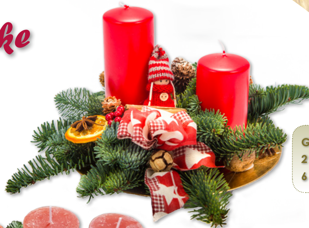
Gesteck, Nr. 3 2 Stumpenkerzen 6 x 12 cm