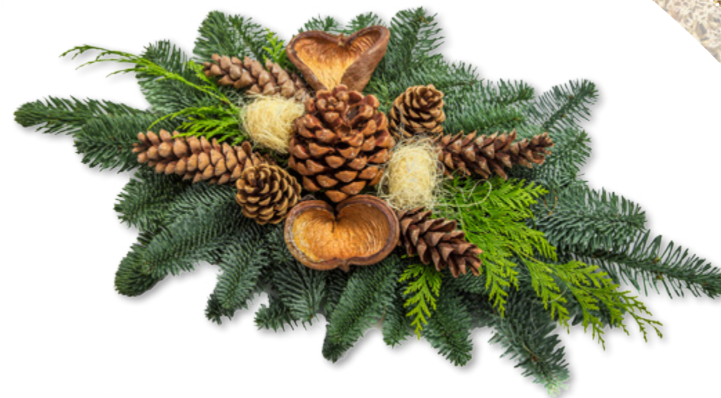
Doppelstrauß, klein ca. 60 cm lang