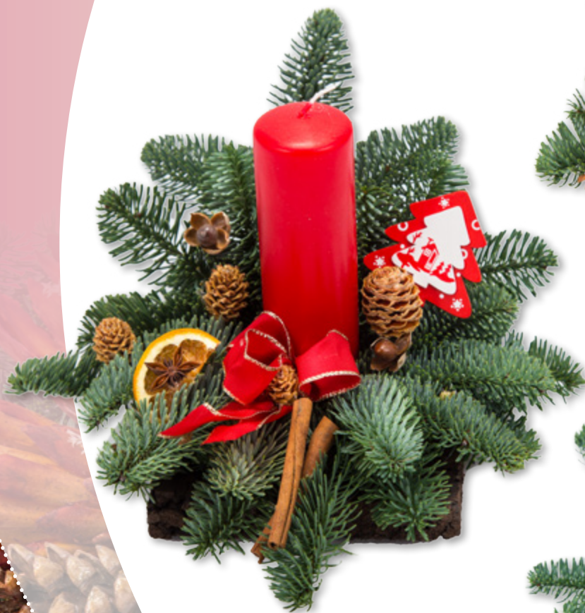
Gesteck, Nr. 4 1 Stumpenkerze 5 x 15 cm