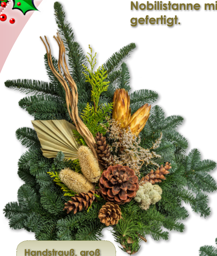
Handstrauß, groß ca. 1000 g

Die Handsträuße werden aus Nobilistanne mit Koniferengrün gefertigt.