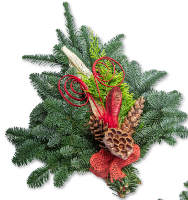
Handstrauß, klein ca. 700 g