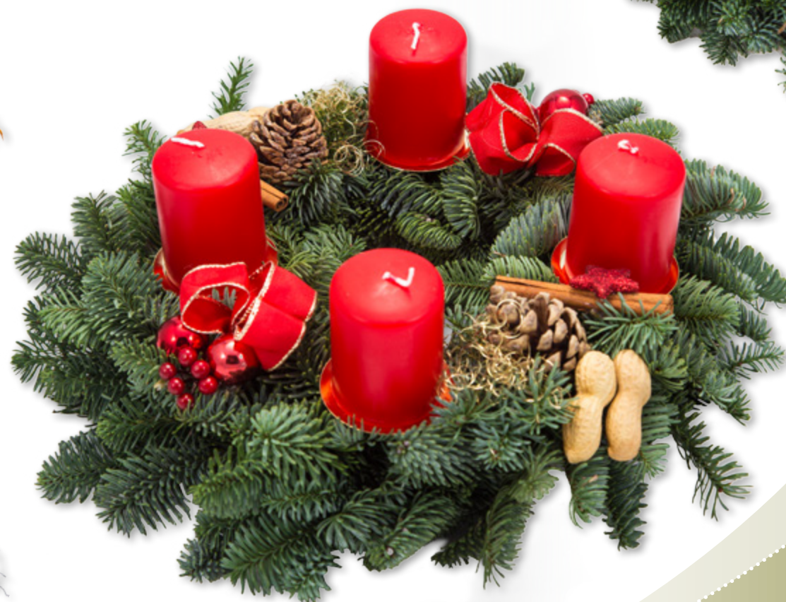
Kranz, dekoriert Ø 25 cm, Kerzen 5 x 7 cm