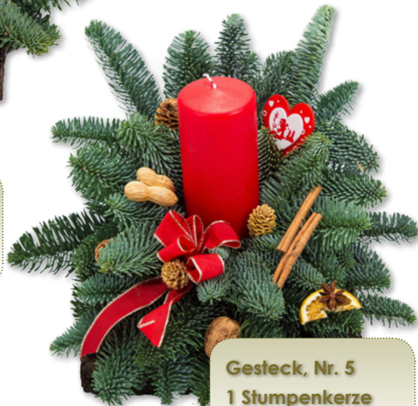
Gesteck, Nr. 5 1 Stumpenkerze 7 x 15 cm