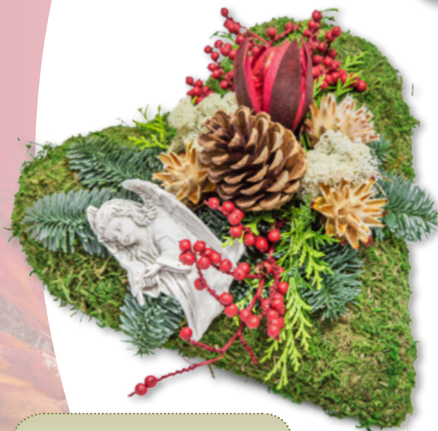
Herz, Moos natur-grün ca. 20 cm lang