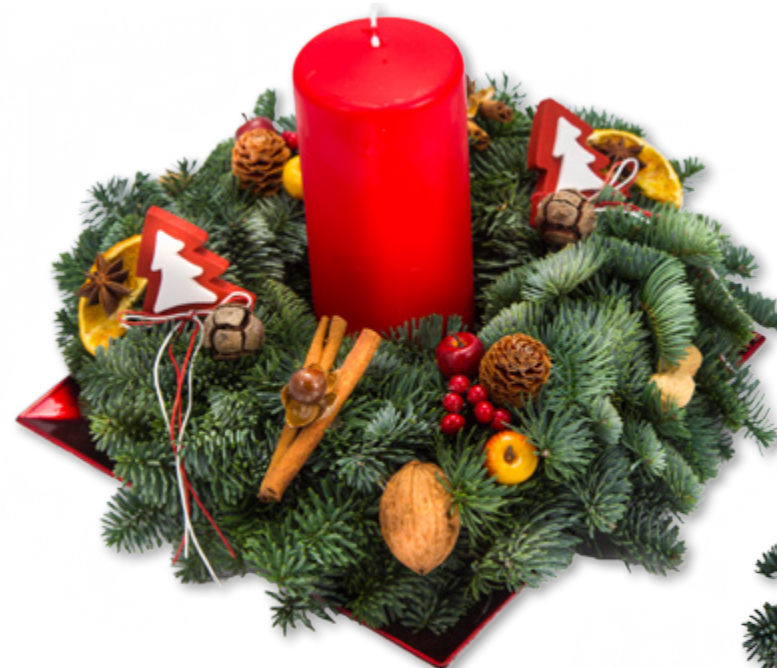
Kranz auf Teller, Ø 18 cm, Kerze 7 x 20 cm

Wir fertigen für Sie Adventskränze aus Nobilistanne von 23 cm bis 80 cm. Ab 30 cm können die Kränze auch rundgebunden (gesteckt) werden. Wir informieren sie gern über unsere Preise.