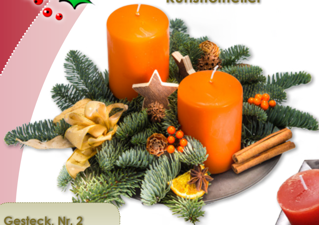
Gesteck, Nr. 2 2 Stumpenkerzen 7 x 10 cm

Mit zwei oder vier Kerzen auf Kunststoffteller